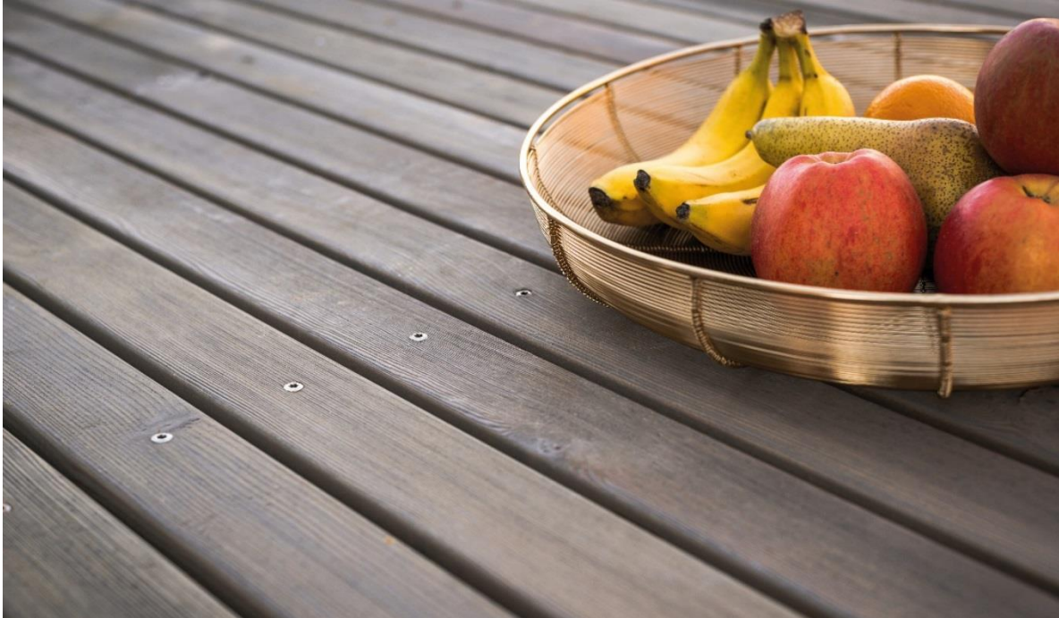
Profilé Apexgrav 10 pour terrasse, par MOCOPINUS