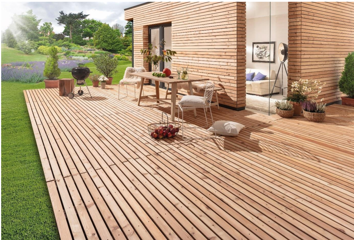
Profilé Laritec, pour une harmonie entre la façade et la terrasse, par MOCOPINUS

Ulm, mars 2019. C'est en s'appuyant sur la popularité du bois massif et sur ses compétences dans la finition du bois que MOCOPINUS a développé les profilés spéciaux Laritec et Alpingrav/Apexgrav, pour des façades et des terrasses qui s'associent à la perfection. Avec la teinte naturelle du premier et l'aspect pré-grisaillé des seconds, le fabricant allemand mise ainsi sur le look 100% bois, 100% nature.