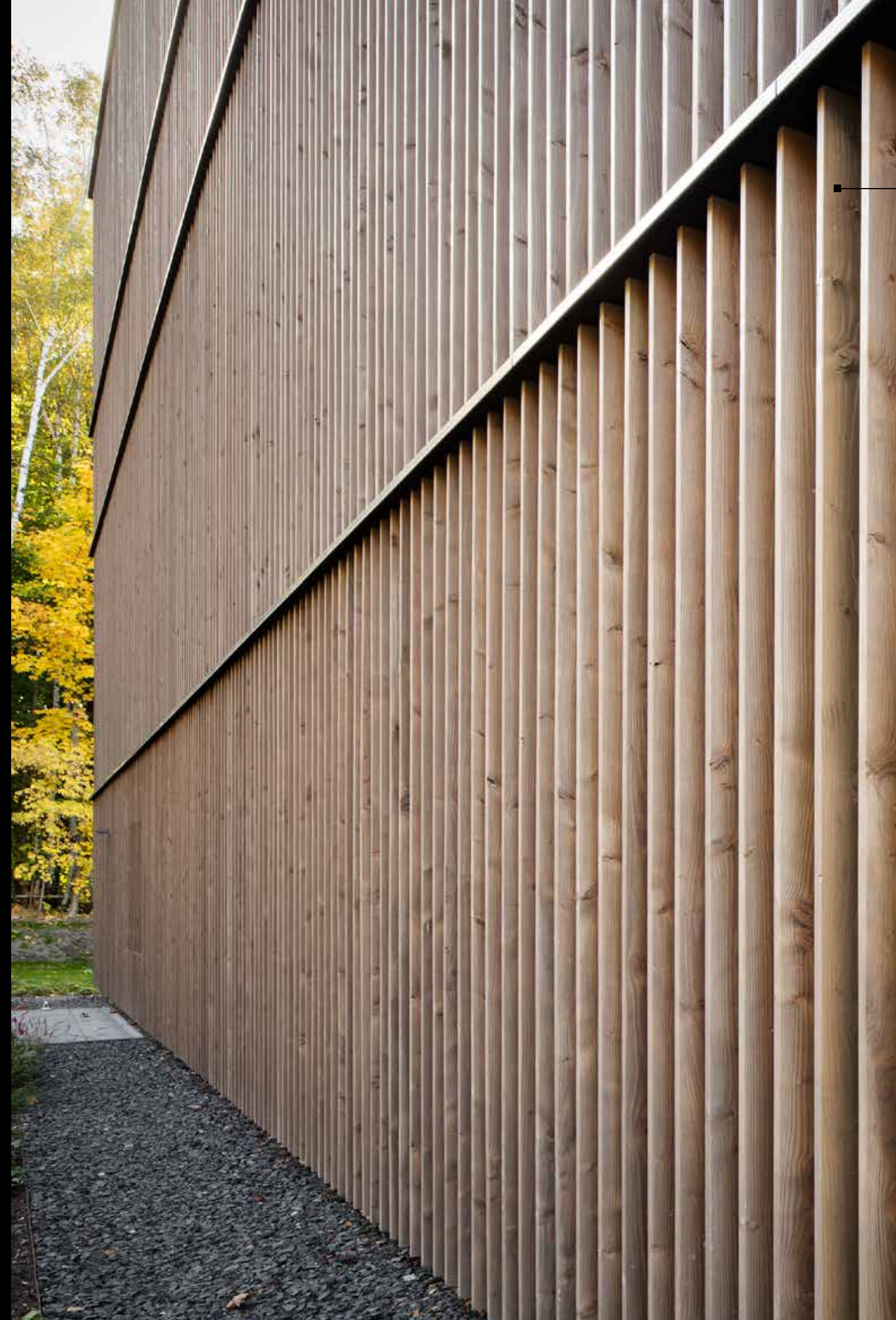
Alpinova 10 V-1221 silbergrau Europ. Douglasie G4F 35x166 mm

Zudem muss eine mit Vergrauungslasur behandelte Holzfassade nie mehr nachgestrichen werden, da die Beschichtung mit der Zeit abwittert und in die natürliche Vergrauung übergeht. Das attraktive, silbergraue Erscheinungsbild der Fassade bleibt dauerhaft erhalten.