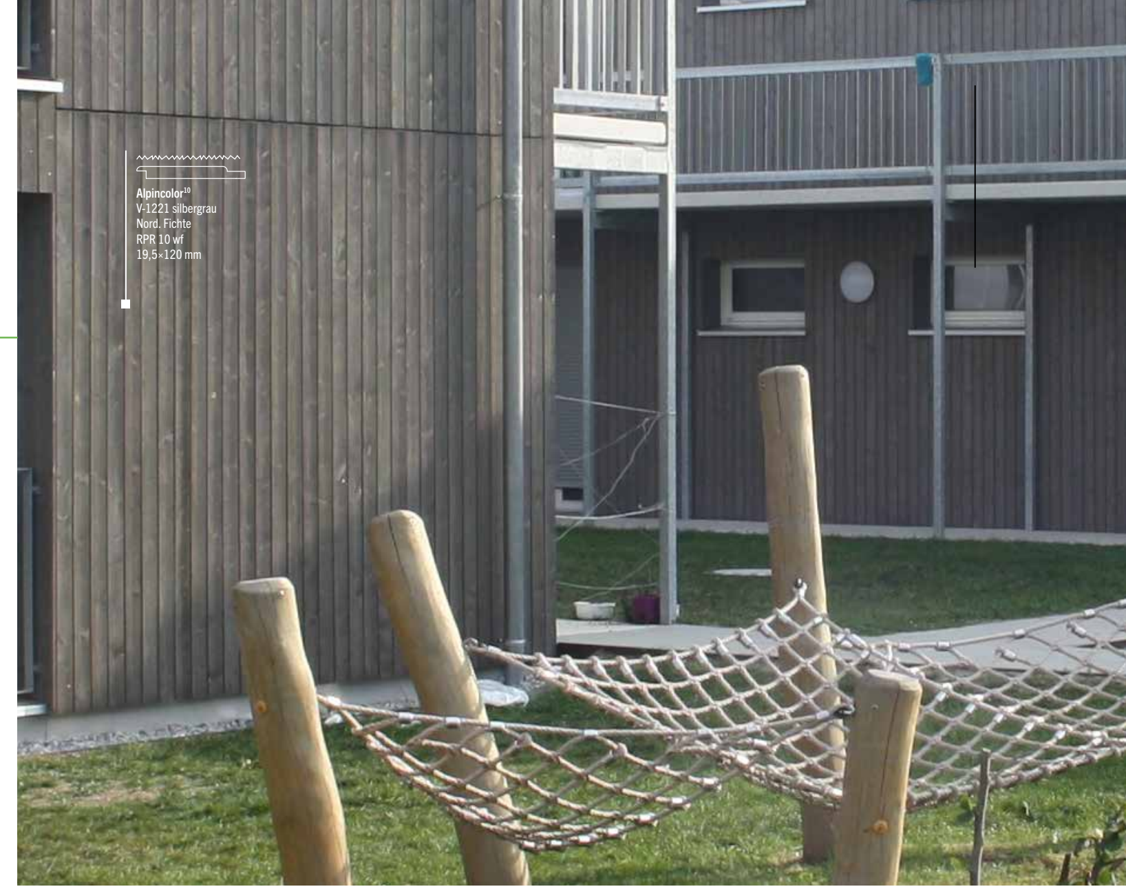
Alpincolor 10 V-1221 silbergrau Nord. Fichte RPR 10 wF 19,5 x 120 mm

Alpincolor, Alpinova und Alpingrav sind Vorvergrauungen und stellen weder einen Holzschutz nach DIN 68800 noch eine Beschichtung nach DIN EN 927 dar. Die Farbwirkung ist abhängig von der Holzart, der Art der Beschaffenheit des Untergrundes sowie der Art der Aufbringung. Beim Einsatz von wasserbasierten Produkten auf Holz können Verfärbungen durch Holzinhaltsstoffe auftreten. Wir empfehlen daher ein Anlegen von Musterflächen für die Farbermittlung.